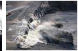
▲ 노천 발파