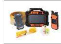
▲ 하이트로닉 II™ 발파시스템