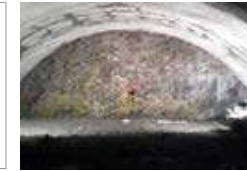
▲ 터널 발파