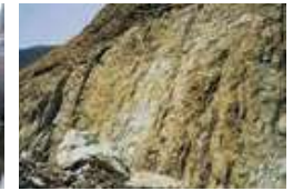
▲ 하이코드 사용현장