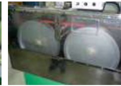
▲ 하이코드 제조공정